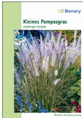
Z 0840 85 Kleines Pampasgras